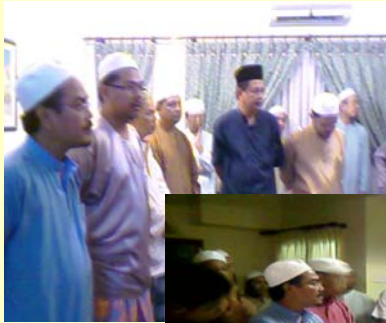
Bacaan Selawat dan Doa Selamat dalam Program Ziarah Rumah ke Rumah Sempena Eidul Fitri 1428H