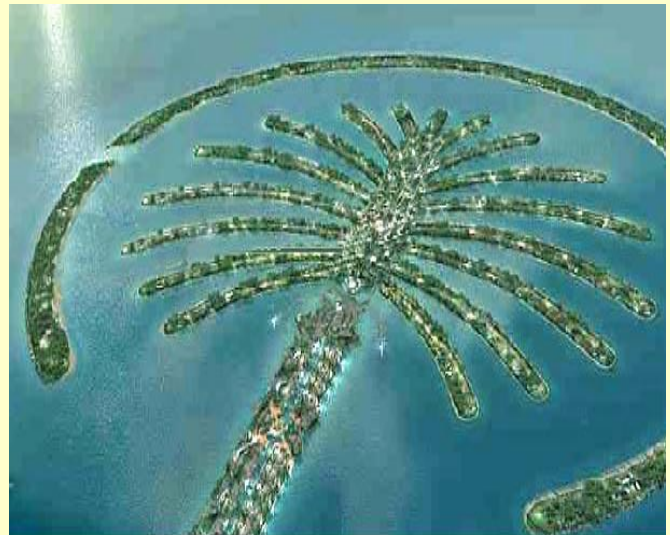
8th Wonder - Man-Made Islands - Dubai

The Palm Jumeirah & the Palm Jebel Ali project are considered as the 8th wonder of the world. They are two man made islands that have a palm tree shape. The Palm Jumeirah is located in the area opposite the Dubai Media city & Dubai internet city. The Palm Jebel Ali would be 15 km. further towards Abu Dhabi & 10 km. away from the borders of Abu Dhabi. These projects would be the ultimate luxury lifestyle anyone would dream of. There are villas, penthouses and apartments. Owners will be able to select the style of the villa, the layout, and finishing in a way that would suit every taste. The two islands would also have theme parks, shops, hotels and many other attractions that would make this place the ultimate destination for luxury, entertainment and relaxation.